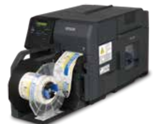
ColorWorks TM-C7520G 超高速全彩色标签打印机