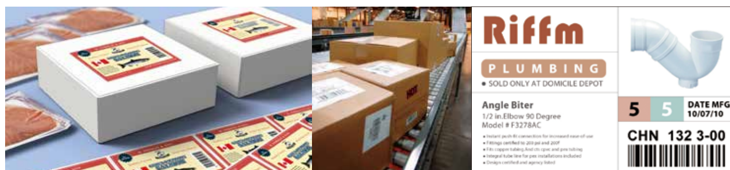
制造行业外箱标签

在彩色标签打印领域，TM-C7520G是使用爱普生最新 PrecisionCore 行式打印技术的全新一代全彩色标签打印机。基于爱普生特有的 ESC/Label 指令语言，替代了预印刷彩色套打可变信息的传统模式，实现超高速高质量的彩色标签按需打印！