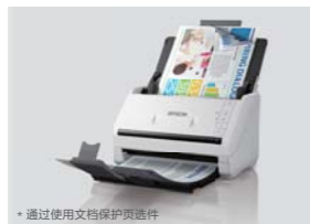
* 通过使用文档保护页选项

使用A4扫描仪也可以扫描A3文件。只需将A3文件进行对折放入A4文档保护页*中进行扫描，扫描仪会识别出文档保护页，并自动将两帧A4图像拼接成一幅完整的A3图像。