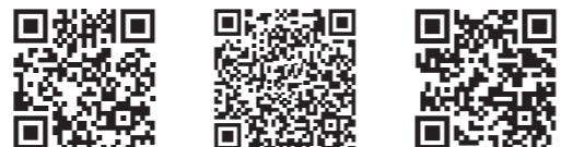
爱普生官方网站 爱普生官方微信 爱普生官方微博

爱普生(中国)有限公司 北京市朝阳区建国路81号华贸中心1号楼4层 官方网站: www.epson.com.cn 官方微信/微博: 爱普生中国 服务导购热线: 400-810-9977 爱普生官方天猫旗舰店: epson.tmall.com