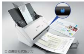
自动进纸模式指示灯

用户在驱动中可选择“自动进纸模式”功能，就能实现无论单次还是多次扫描都可以自动进纸；无需用户再通过扫描驱动或面板发送扫描指令。