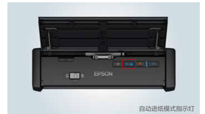
自动进纸模式指示灯